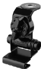
AP1733 SUPORTE P/ PORTA MALAS BI-ARTICULADO PRETO

Frequência VHF...: 144-148 MHz Frequência UHF...: 430-440 MHz Potência Máxima: 150 Watts Impedância.....: 50 Ohms R.O.E.....: Menor que 1,5:1 Ganho VHF.....: 0 dB - 1,3 dBi Ganho UHF.....: 2,5 dBi Altura.....: 440 mm Peso.....: 105g