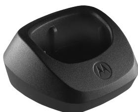
53962 – Base da bandeja do carregador