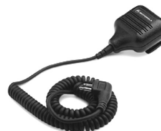
HMN9026 – Microfone com alto falante remoto