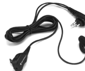
HMN8435 – Fone de ouvido e microfone com clipe e botão push-to-talk (PTT)