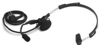
BDN6773 – Fone de cabeça com microfone boom giratório