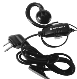
RLN6423 – Fones de ouvido giratórios