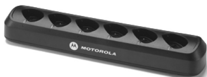
53960 – Carregador múltiplo para 6 rádios