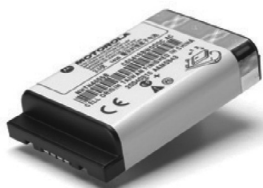
53964 – Bateria Li-ion de alta capacidade