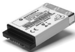
53963 – Bateria Li-ion de capacidade padrão