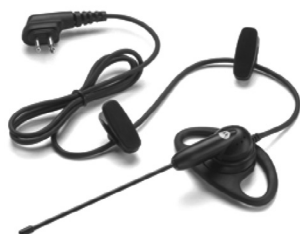
56518 – Fone de ouvido estilo D com microfone boom