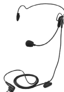
53815 – Fone de cabeça leve com microfone boom