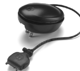
53969 – Fonte de alimentação para carga rápida de 1 hora